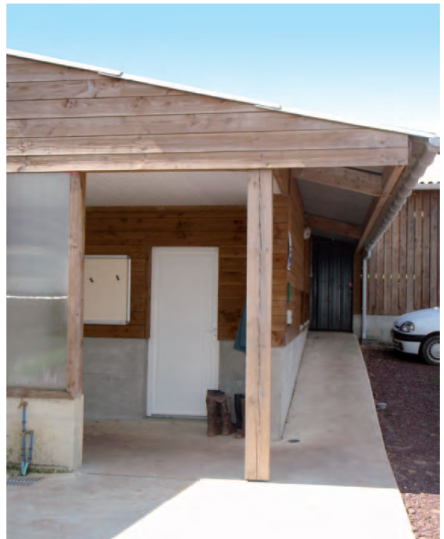
L'accès à l'élevage se fait par un auvent d'accueil et une coursive couverte menant aux locaux de soins.

La réussite technique et architecturale de ces bâtiments est le fruit d'une conception approfondie, et du savoir faire des concepteurs et constructeurs Charte Qualité. Une prestation de conception est un investissement très rentable qui se récupère largement dans la réussite économique du projet.